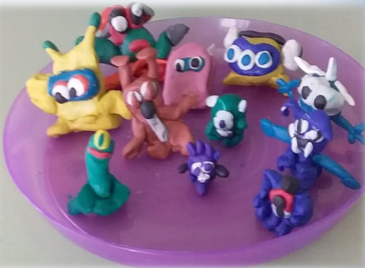
• Лепка «Космические гости»