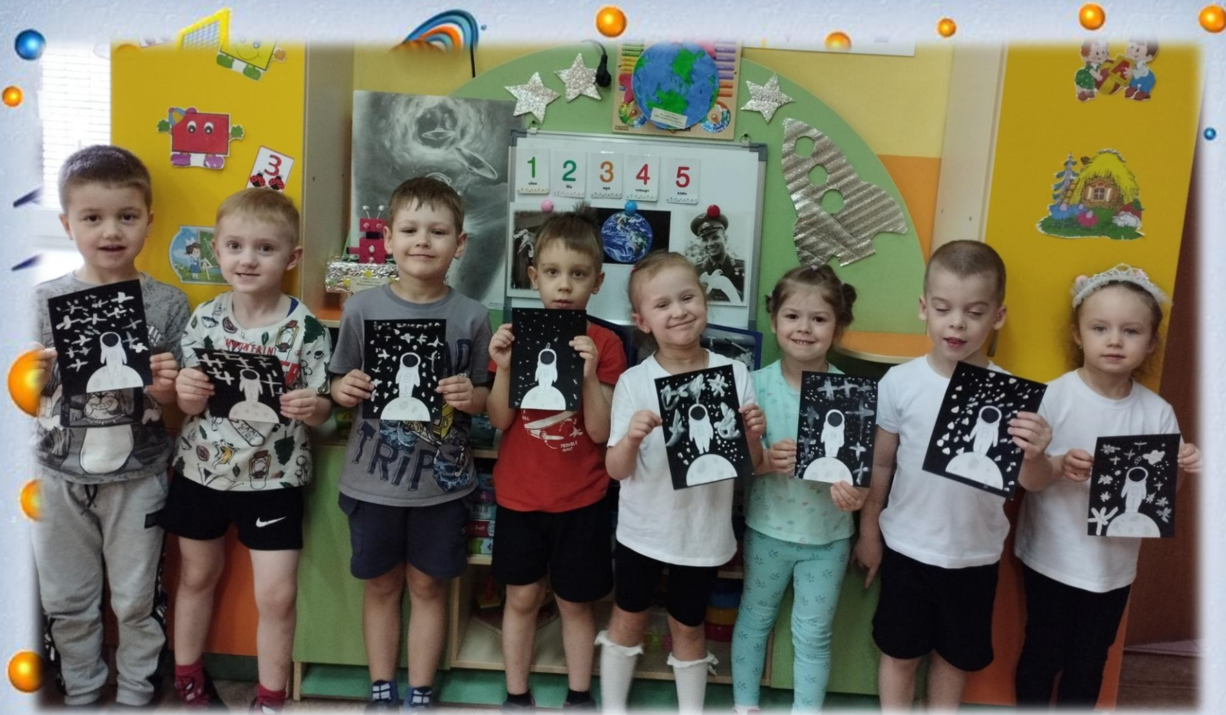
Аппликация с элементами рисования «Покорение космоса»