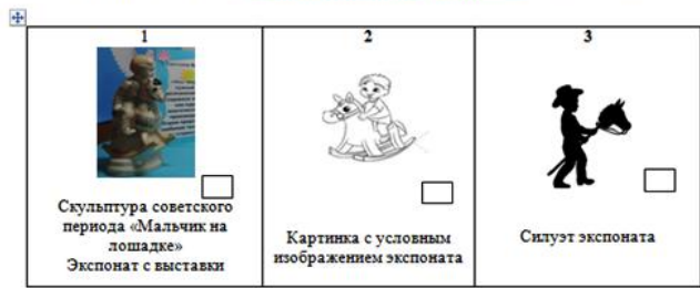
Пример усложнения «карточек-находилок» с чек-листами для педагогов