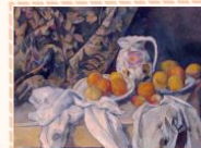
Поль Сезанн «Натюрморт с драпировкой»