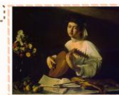
Караваджо «Юноша с лютней»