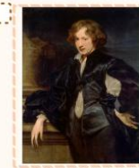
Антонис ван Дейк «Автопортрет»