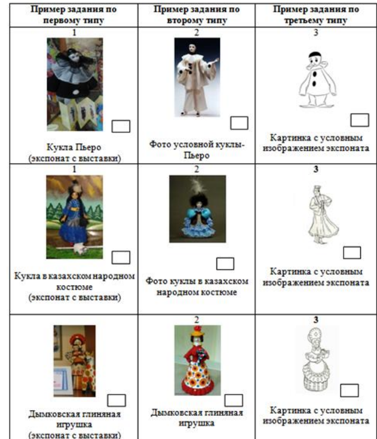
Пример карточек с «чек-листами» для «игры-находилки» «Найди экспонат»