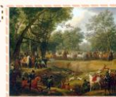
Карл Верне «Наполеон на охоте в Компьенском лесу»