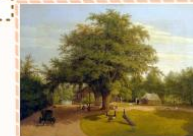
Петер Людвиг Лютке «Остров Павлинов»