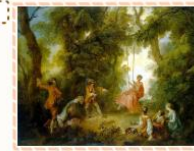
Никола Ланкре «Качели»