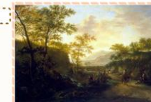
Ян Бот «Итальянский пейзаж с дорогой»