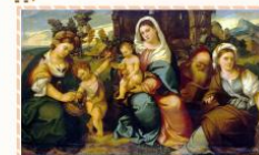
Бонифацио Веронезе «Мадонна с младенцем...»