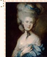
Томас Гейнсборо «Портрет дамы в голубом»