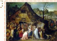
Ян Брейгель старший «Поклонение волхвов»