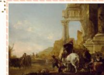
Ян-Балтист Венник «Переправа через брод»