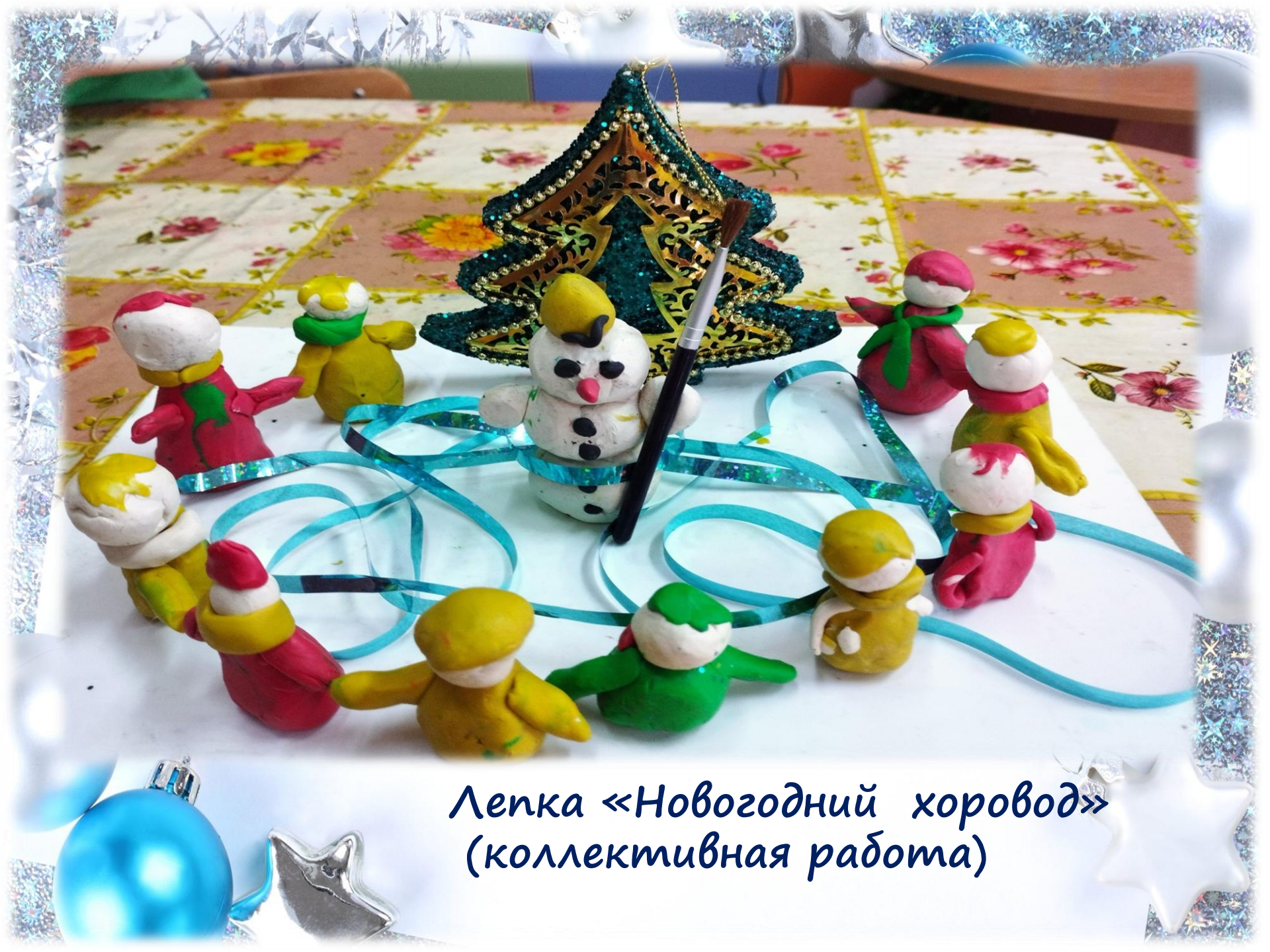
Лепка «Новогодний хоровод» (коллективная работа)