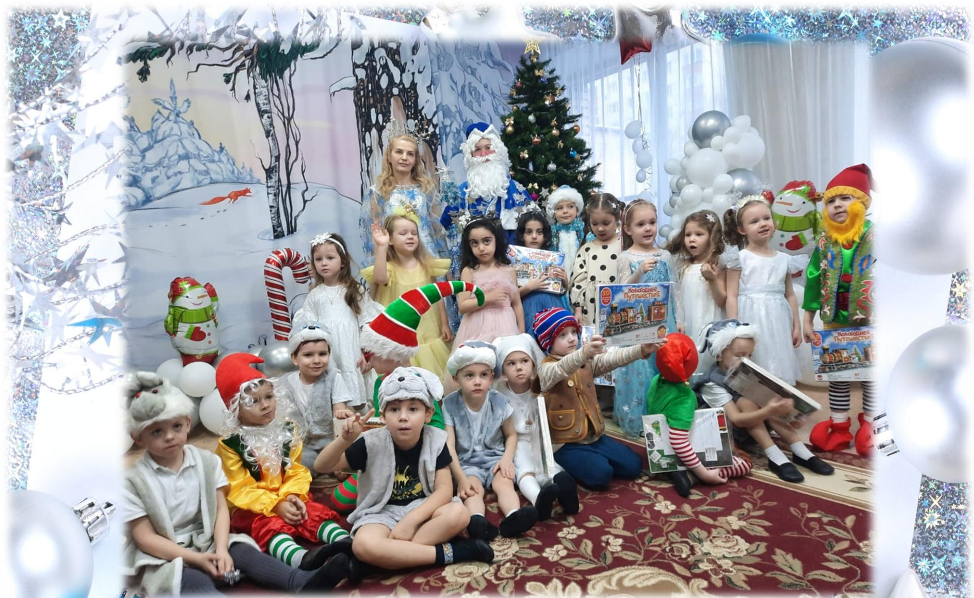
Новогодний утренник «Волшебный фонарь»