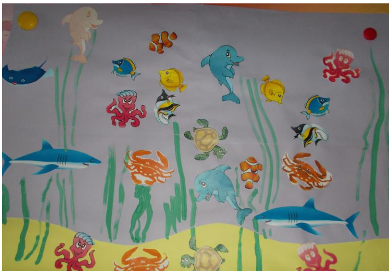
Аппликация «Морские обитатели»