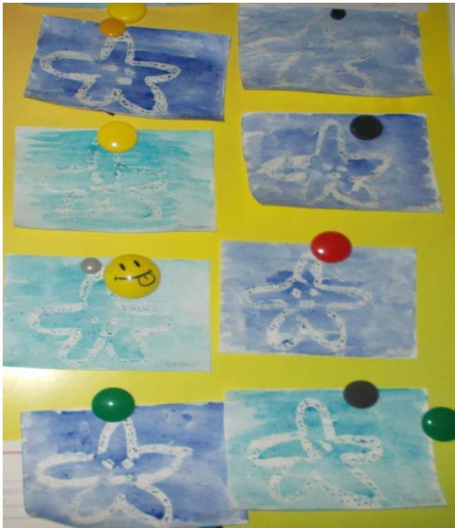
Рисование свечей «Морская звезда»