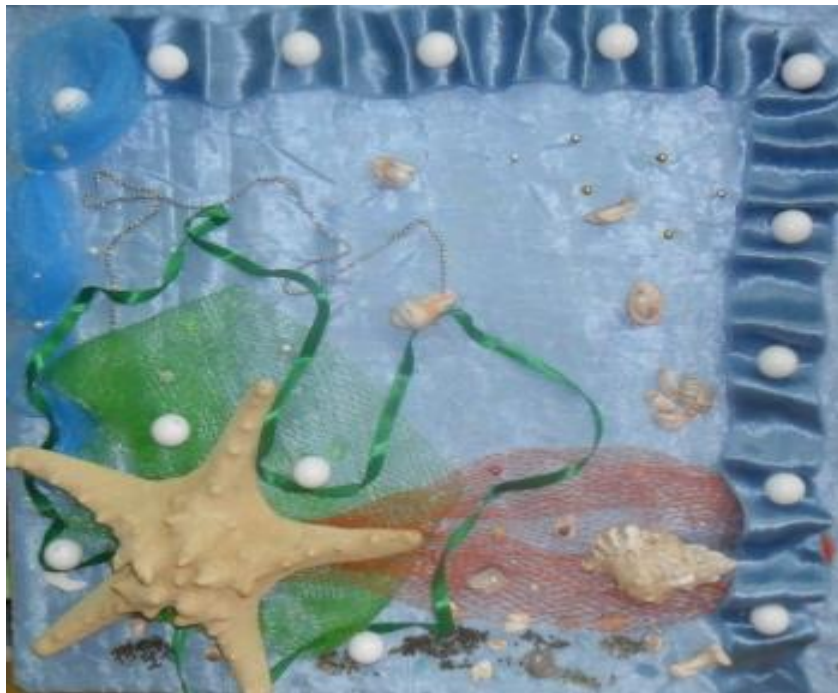
Коллективная работа «Морское панно»