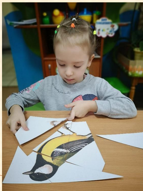
Игра «Собери птичку»